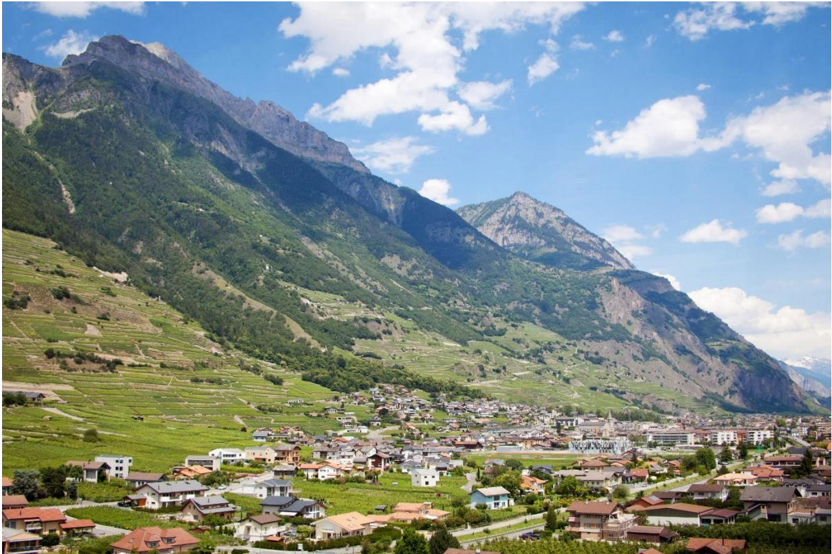
Vignoble de Fully