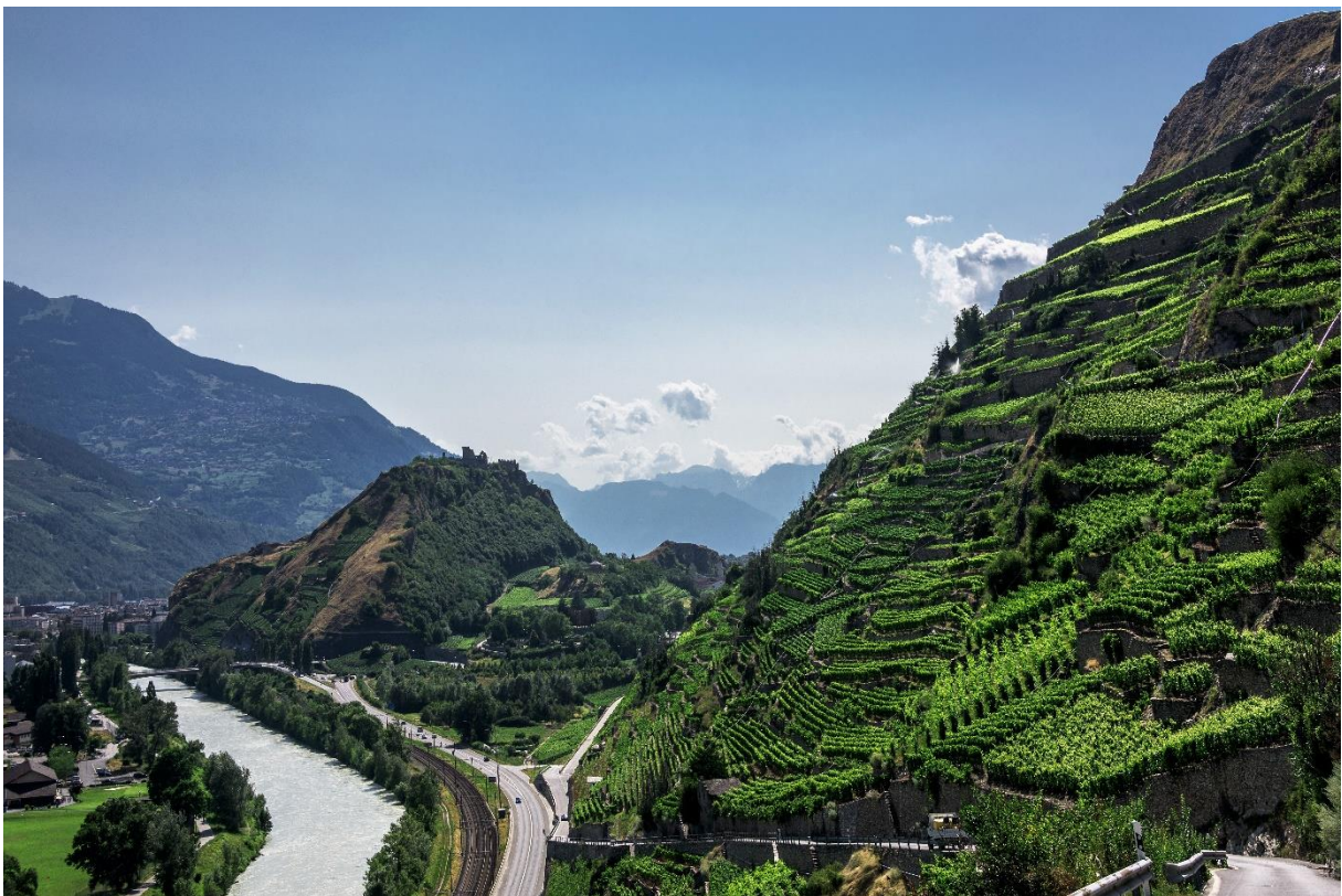
Vignoble en terrasses, Sion