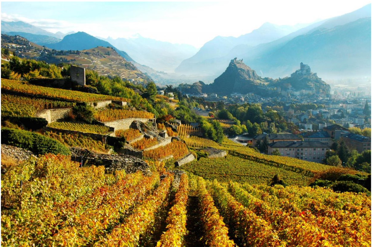
Vignoble de Sion