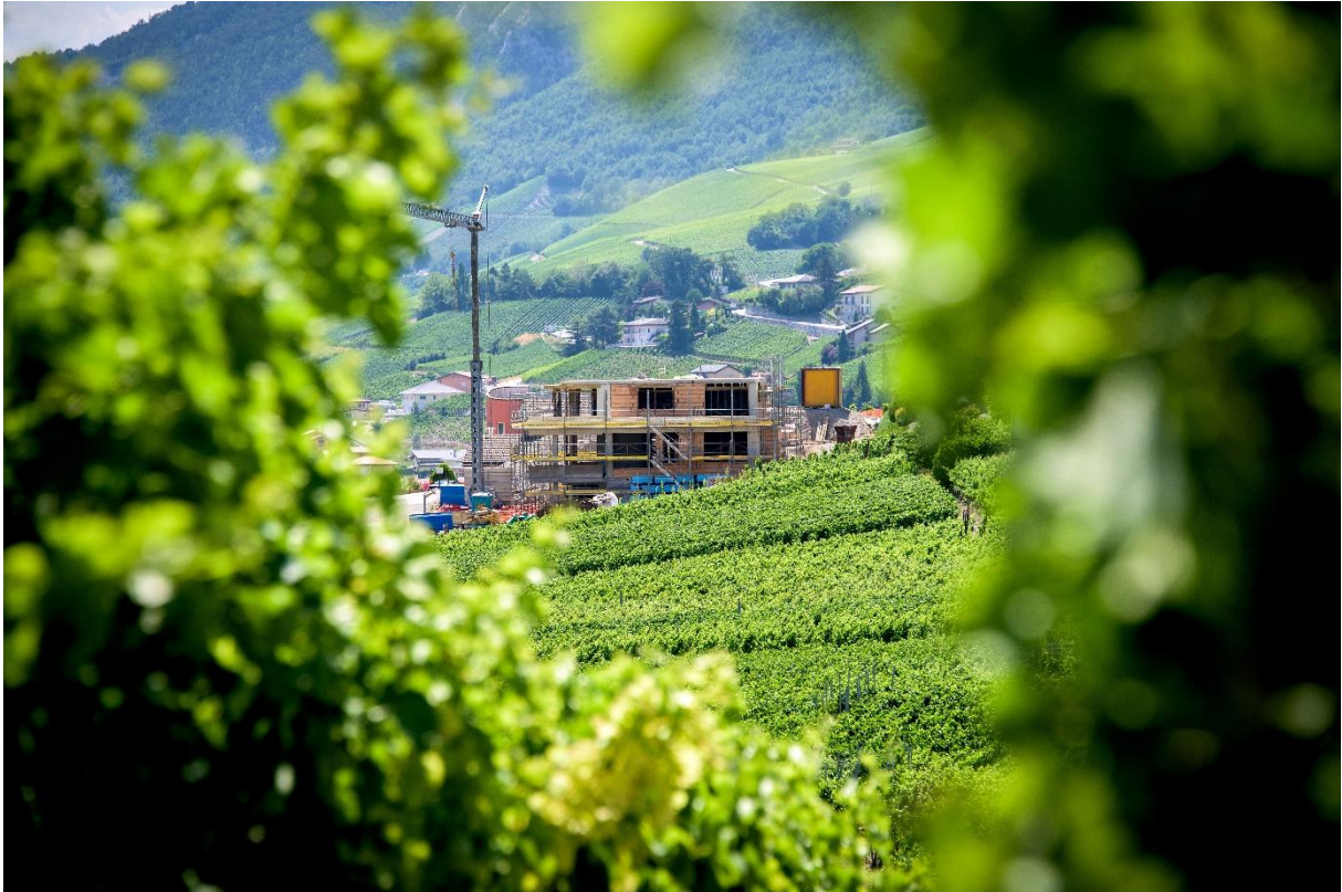
Vignoble de Miège