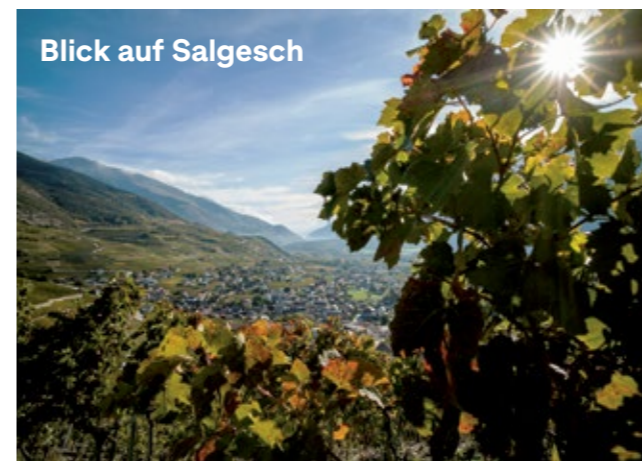
Blick auf Salgesch