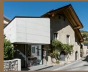
Weinmuseum – Sierre

Das Weinmuseum liegt im Herzen des Wallis. Es umfasst den Rebweg und zwei Ausstellungsorte: in den Gemäuern des Château de Villa in Sierre und im Weindorf Salgesch. Das Weinmuseum – Sierre zeigt thematische Wechselausstellungen. In der Dauerausstellung in Salgesch entdecken Sie die Geheimnisse der Walliser Weine und lernen den jahrtausendealten Bergweinbau kennen. Ein reichhaltiges Veranstaltungs- und Kulturvermittlungsprogramm runden das Angebot ab.