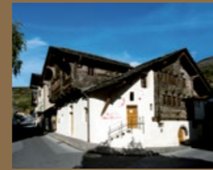
Weinmuseum – Salgesch