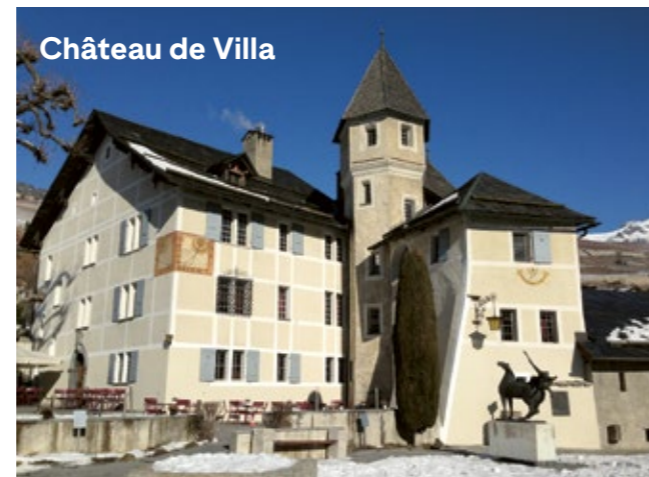
Château de Villa