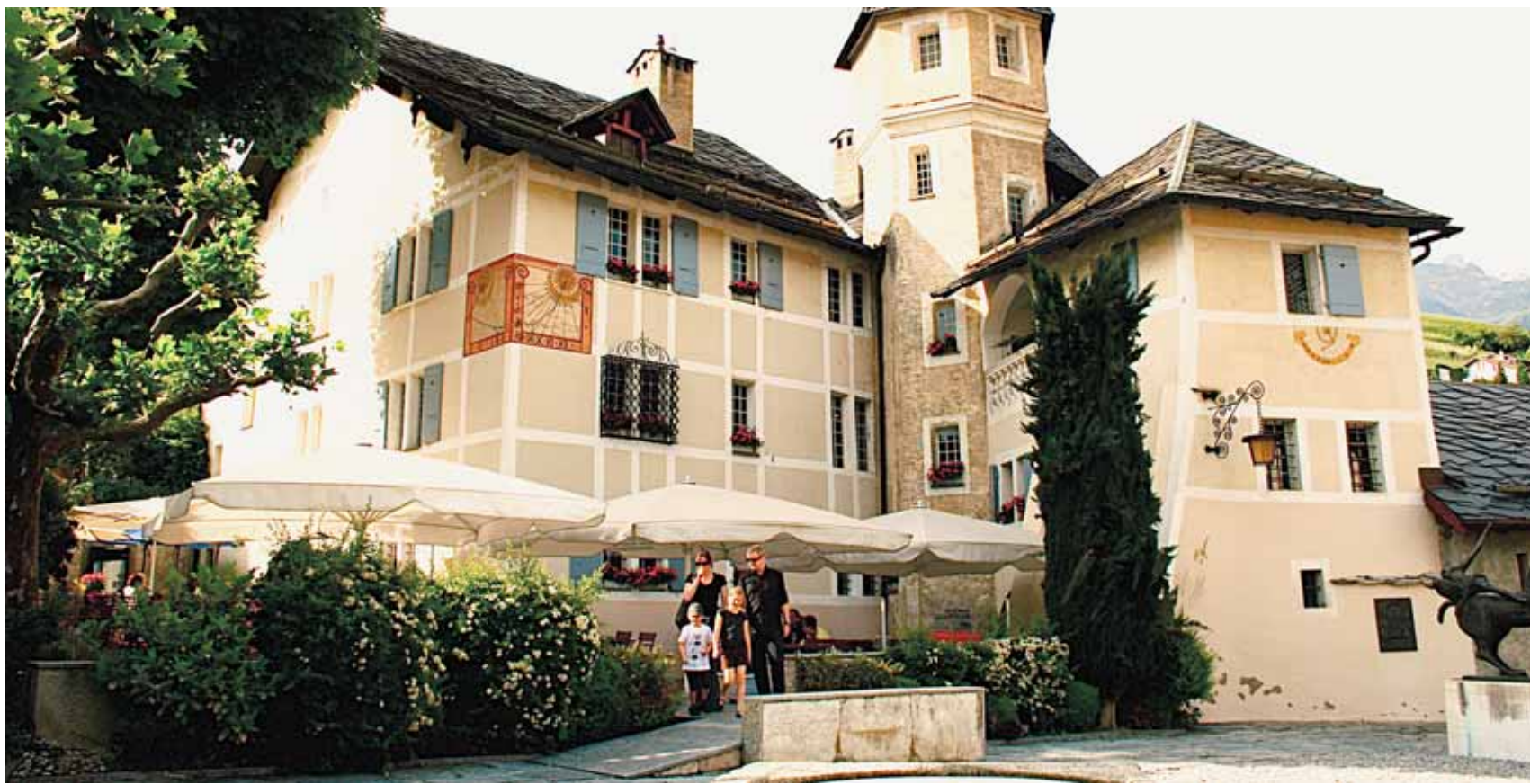
Le château de Villa, à Sierre.

« Traditionnellement, la culture de la vigne en Valais visait à satisfaire la consommation personnelle des vigneronnes », souligne Mme Zufferey. Elle avait une valeur sociale importante: on accueillait ses amis avec un verre. Puis, chacun des villages a