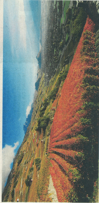
Paysage de vigne: cette photo tirée du livre est signée J. Marguëlisch.

La vigne, sang de la terre valaisanne, est au cœur d'un ouvrage de référence. Rencontre avec deux femmes qui ont participé à cette belle aventure.